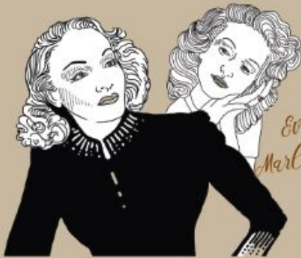
Evelyn Künneke Marlene Dietrich